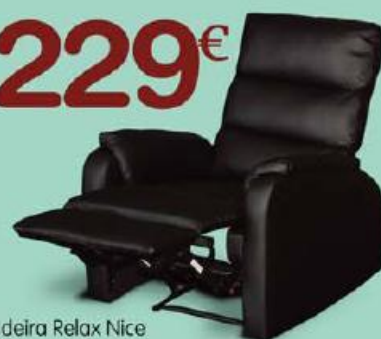
Cadeira Relax Nice