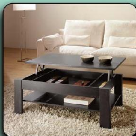
Mesa de Centro Havana Club