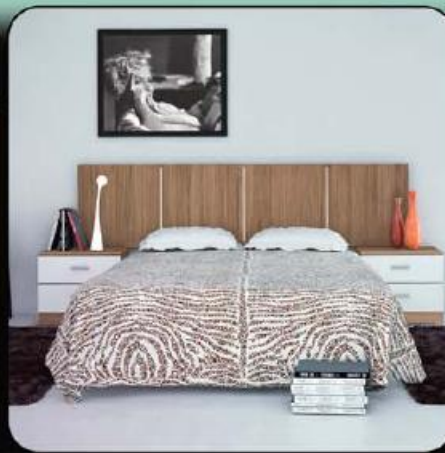
Quarto Las Vegas