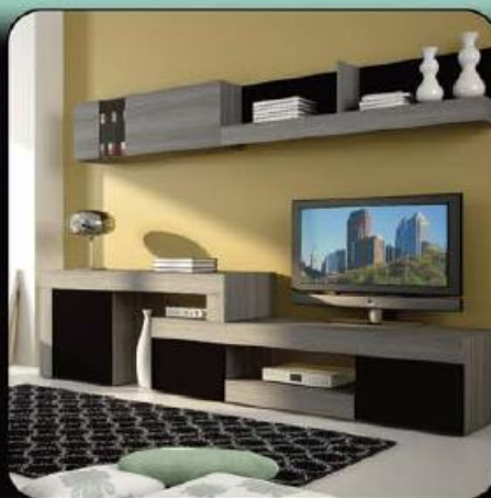
Móvel TV Mississippi