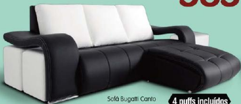
Sofá Bugatti Canto