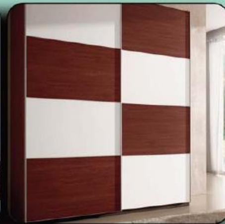
Roupeiro 606 portas correr