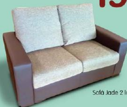
Sofá Jade 2 lugares