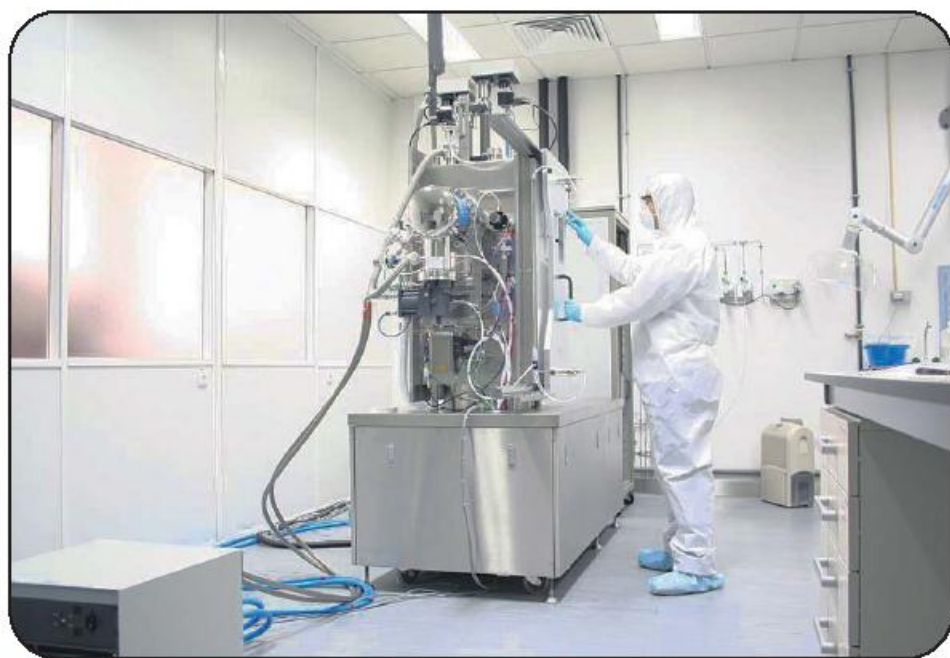
Centro de Nanotecnologia ao serviço da investigação na área dos têxteis