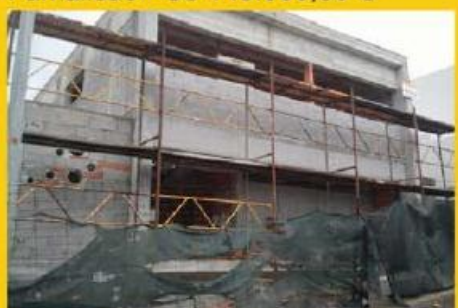
Morada de canto para restauro, T3, a 5min do centro da cidade, fantastica oportunidade...82.500,00 €