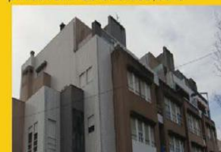
T3 duplex elevador a sair no andar, com garagem p/ 2 carros, com terraço... - Só 130.000 €