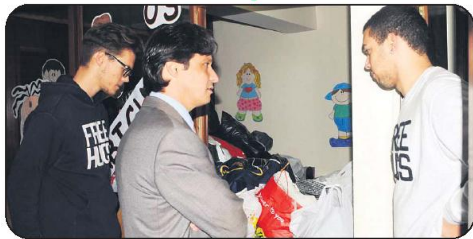
cleo de Estudantes de Ciências do Desporto e Educação Física da Universidade de Coimbra.

A iniciativa decorreu entre 17 e 24 de Dezembro, na Praça D. Maria II e ainda nas cidades do Porto e Coimbra, através da Associação de Estudantes de Desporto da Universidade do Porto e do Nú-