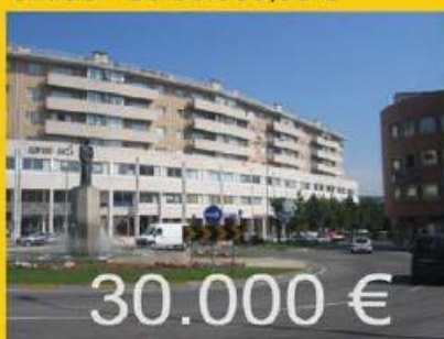
Escritorio com uma area de 50 m2, em calendario, em frente a caixa geral depositos. 30.000 €