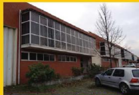
Pavilhao Industrial c/ 1300 m2 + 700m2 logradouro, parque privativo... Só 300.000,00 €