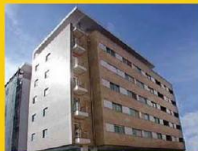
T2 como novo ed. Famicasa, com garagem fechada e varios extras - Só 90.000,00 €