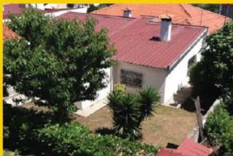
Vivenda T3+1 em Antas de 4 frentes com terreno de 900 m2 junto a Famalicao - Só 145.000,00 €