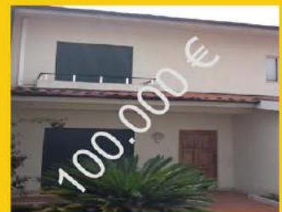
Em Calendario!!! Exelente oportunidade!!!