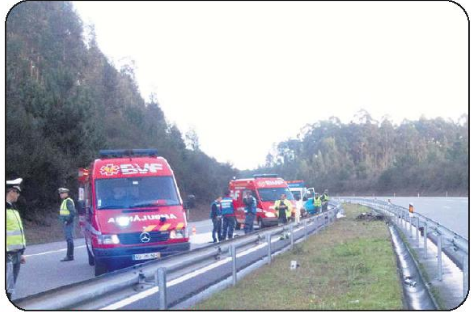
Acidente ocorreu ao quilómetro 6,5 da A7, já próximo de Vila do Conde