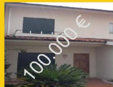
Em Calendario!!! Exelente oportunidade!!!