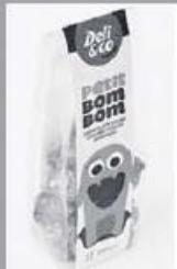
Bombons Kids Deli 180g 190 pontos