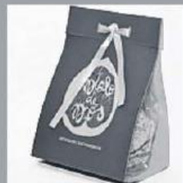
Biscoito de Sesamo 150g 315 pontos