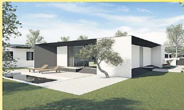
Vivenda T3 terrea junto ao centro da cidade com áreas e acabamento fantástico, num lote de terreno de 520 m2!!! Venha conhecer!!!