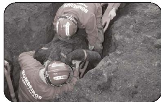
Mogege: deslizamento deixou duas pessoas soterradas