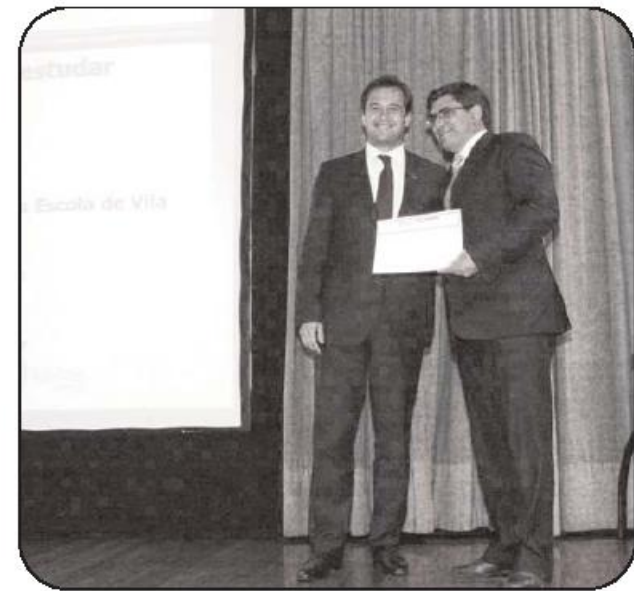
Vereador da Educação foi quem recebeu o prêmio

Os "Prémios de Reconhecimento à Educação" são uma organização conjunta das instituições de consultoria e Formação Profissional Groupvision através da iniciativa "Ensino do Futuro" e da