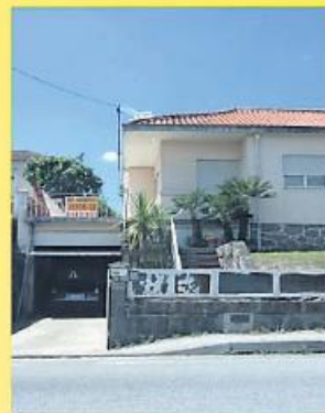
Vivenda Antas terreno 1000 m2 165.000,00 €