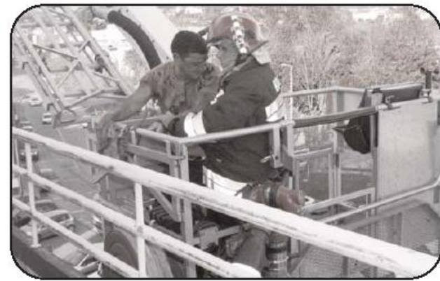
Ribeirão: ferido queimado, retirado pela autoescada a partir do 3.º andar de um prédio