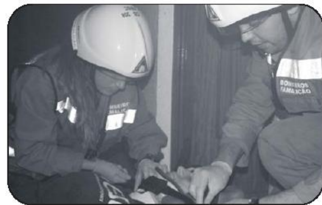
Explosão causa feridos graves