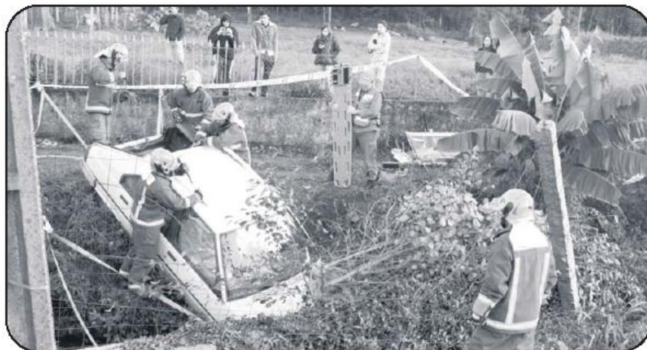
Na Lagoa, um acidente de viação resultou na queda de um veículo a um ribeiro. Dois feridos para resgatar

Este foi o cenário de um simulacro promovido pelos BVVNF, no passado sábado, envolvendo 60 operacionais e 20 viaturas. Os bombeiros, aos quais foram escondidos até ao último momento os locais e tipologia dos cenários, tiveram que acudir a diferentes ocorrências em simultâneo, testando