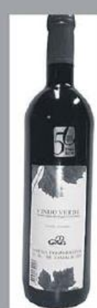
Vinho Verde Tinto Vinhão Frutivinhos 0,75L 190 pontos