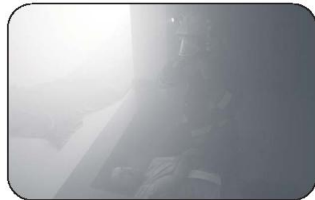
Bombeiros socorreram feridos debaixo de fumo denso

quanto verdadeiro teste à capacidade decisória das chefias, à organização no envio dos meios, e dos operacionais, numa lógica de aprendizagem e aperfeiçoamento através da prática que considera essencial em matéria de socorro.