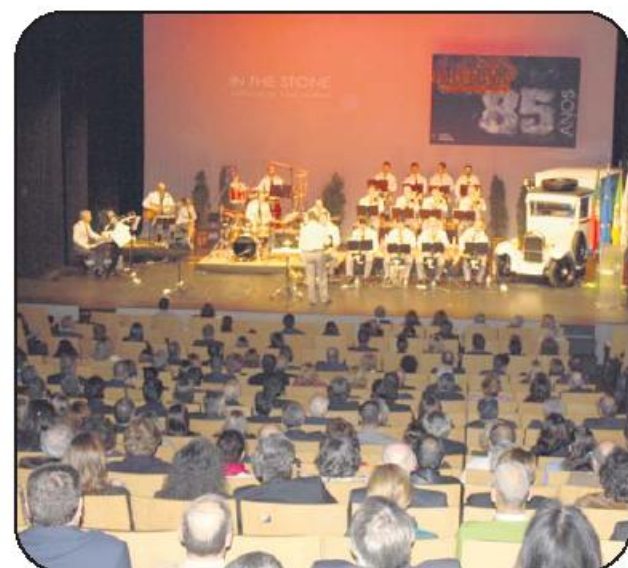
Orquestra Ligeira do Exército animou gala, com temas do passado e do presente