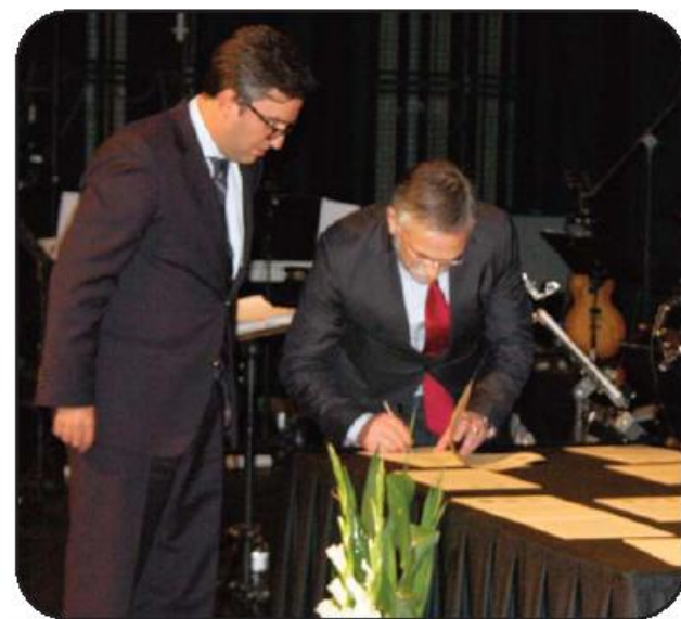
Protocolos com Câmara, Junta de Outiz, Citeve e Lusíada

À margem das novidades que traçam um novo rumo no futuro da corporação, o serão foi preenchido com um concerto da Orquestra Ligeira do Exército, que durante uma hora fez ecoar temas do passado e do presente no Grande Auditório da Casa das Artes, interagindo com o público.