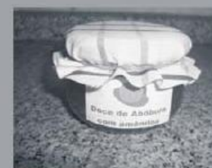
Doce de Abobora Caseiro 150g 190 pontos

valesdedescontoporpaper@sapo.pt TLM.: 931 990 020