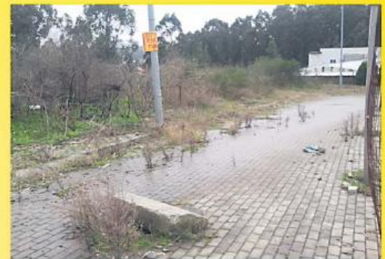
Terreno industrial em Calendário com uma área de 1.450 m2. Infra-estruturado!!! 60.000,00 €Arr