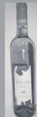
Vinho Verde Rosé Frutivinhos 0,75L 180 pontos

Além de 30 kg, os pontos são aumentados em 10 unidades por cada mais 5 kg, até ao limite de 200 kg. Não recolhemos no domicílio quantidades inferiores a 20 Kg. A tolerância da pesagem é de mais ou menos 100 gramas. Para quantidades superiores a 30 Kg, a atribuição de pontos e a tolerância serão negociados caso a caso.