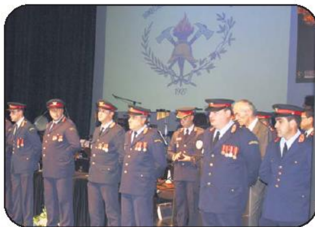
28 bombeiros receberam novas divisas (20 bombeiros de 2.ª e 8 sub-chefes)

Instado sobre os custos deste complexo o mesmo responsável admite que são elevados, mas acredita que isso não será obstáculo à concretização, em razão das sinergias que tem sido possível criar em torno do projeto. Em 2013 deverá ficar já concluída uma parte do complexo, nomeadamente uma construção metálica para reconstituição de ambiente de fogo. "Depois há uma série de outras valências, como salas de aula e balneários que se irão fazendo consoante as possibilidades", concluiu António Meireles a propósito.