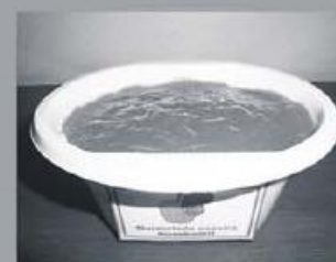
Marmelada Caseira 100g 150 pontos