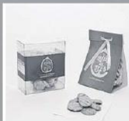
Biscoito de Erva Doce 150g 315 pontos