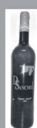
Vinho Verde D. Sancho I Frutivinhos 0,75L 220 pontos

O Povo Famalicense vai promover produtos famalicensenses, em cabazes que serão entregues por troca com cartão e papel usados e embalagens de plástico de qualquer natureza. São dois cabazes padrão, ou feitos à medida, correspondendo a diferentes quantidades recolhidas, num sistema de pontuação semelhante ao que vigora na campanha de vales de desconto por papel. Esta campanha estará em vigor até ao final do mês de Janeiro de 2013.