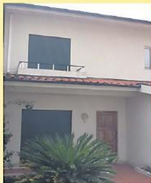
Morada T3 em Calendário!!! 100.000,00 €

Rua Ernesto Carvalho, Ed. Nápoles - Loja 1 | Vila Nova de Famalicão 252 318 300 - 916 143 360 | comercial@imobolsa.com | www.imobolsa.com