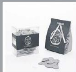
Biscoitos de Caju 150g 315 pontos