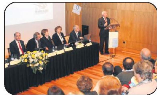
Pequeno Auditório encheu-se para colóquio sobre a diabetes

Consciente do flagelo que é a diabetes, que segundo a Organização Mundial de Saú-