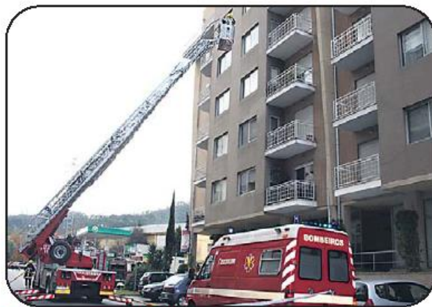
Fogo terá tido origem em chaminé comum

Apesar do aparato gerado no local com a intervenção dos soldados da paz, não