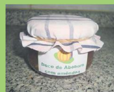
Doce de Abobora 150g 190 pontos