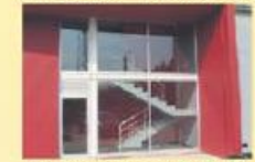
Armazem com 300 m2 145.000,00 €