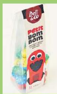
Bombons Kids Deli 180g 190 pontos