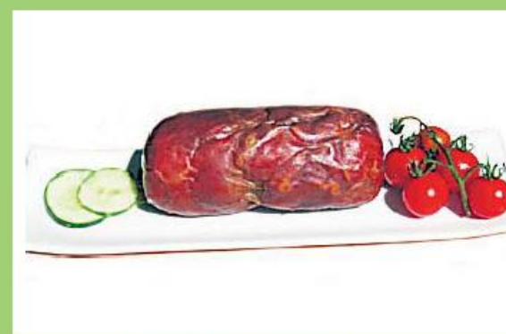
Salpicão Adalma 300g 155 pontos

O Povo Famalicense vai promover produtos famalicensenses, em cabazes que serão entregues por troca com cartão e papel usados e embalagens de plástico de qualquer natureza.