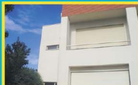
Morada Sta. Maria Oliveira ref: 1447

Morada Geminada T3 com logradouro lateral e nas traseiras. Garagem fechada para 2 viaturas. Financiamento a 100%, com spread muito atrativo. Preço: €143.000,00. Prestação: 511,09€/mês (prazo: 40 anos).