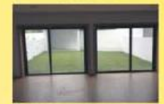
Moradia Nova - Antas. 185.000,00 €