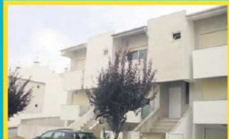
Morada em Gondifelos ref: 1441

Morada em Banda de tipologia T3, com recuperador de calor e roupeiros embutidos. Financiamento até 100% e spread especial. Preço: €87.000,00. Prestação: 337,03€/mês (prazo: 40 anos).