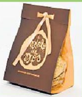
Biscoito de Sesamo 150g 315 pontos