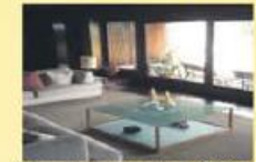
Vivenda Fantastica 600 m2 Em Gaviao - 190.000,00 €