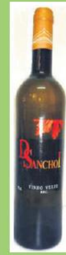
Vinho Verde D. Sancho I Frutivinhos 0,75L 220 pontos