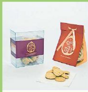
Biscoito de Erva Doce 150g 315 pontos