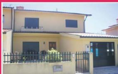
Morada em Calendário ref: 1416

Moradias junto ao Parque da Cidade, com localização muito privilegiada face aos eixos rodoviários, nomeadamente à Variante Nascente. Equipadas com aquecimento central, asp. central, recuperador de calor, etc. Consulte-nos!