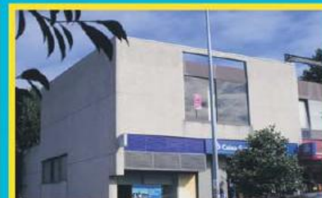
Escritório em Joane ref: 1430

Morada Geminada T3 em ótimo estado de conservação. A 3km da auto-estrada e a 10km do centro de Famalicão. Condições especiais de financiamento, até 100%, com spread muito atrativo. Preço: €144.000,00. Prestação: 514,67€/mês (prazo: 40 anos).