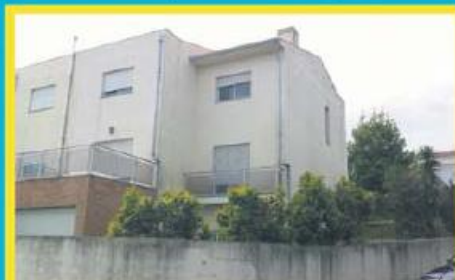
Morada em Castelões ref: 1424

Morada Geminada T3, com recuperador de calor na sala, roupeiros embutidos e garagem fechada para 2 viaturas. Financiamento, até 100%, com spread muito atrativo. Preço: €142.000,00. Prestação: 507,52€/mês (prazo: 40 anos).