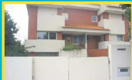
Morada em Novais ref: 1445

Morada Isolada T4 de 3 pisos, com 616m 2 de terreno. Financiamento até 100% com spread de 1%! Preço: €168.000,00. Prestação: 464,81€/mês (prazo: 40 anos).