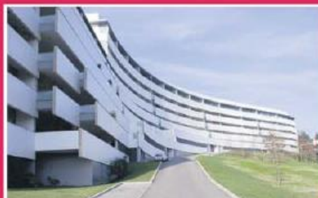
T2 no Vinhal ref: 1393

Apartamento T2 com excelente terraço no centro de Famalicão, inserido em zona habitacional nobre. Equipado com estores elétricos, aquecimento central e vídeo porteiro. Cozinha mobilada e equipada. Aparcamento privado. Preço: €112.500,00.