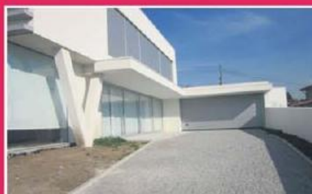
Morada T3+1 em Joane ref: 1336

Morada de 3 frentes junto ao centro de Famalicão, recentemente remodelada no interior. Equipada com aquecimento central (com caldeira a gás/óleo). Amplo espaço exterior com algumas árvores e barbecue. Preço: €125.000,00.