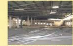
Armazem com 7.000 m2 Sob consulta!!!