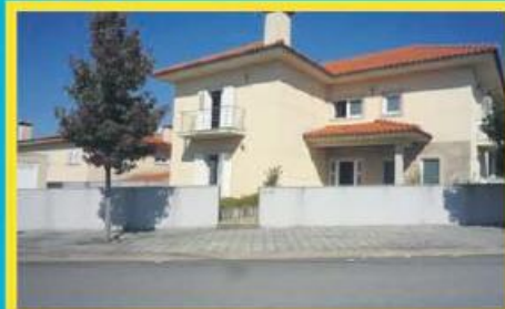
Morada em Gondifelos ref: 1444

Morada em Banda de tipologia T3, com recuperador de calor e roupeiros embutidos. Financiamento até 100% e spread especial. Preço: €87.000,00. Prestação: 337,03€/mês (prazo: 40 anos).