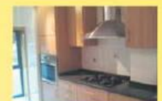
12 antas - Exel.vistas 83.500,00 €