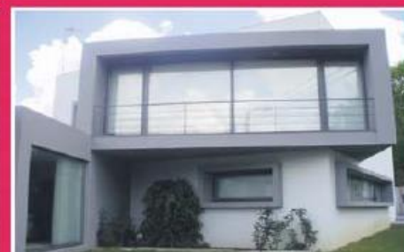
Morada Isolada T4 ref: 1395

Morada Geminada, equipada com painéis solares, portões automatizados, recuperador de calor, aquecimento central completo, focos embutidos, blackout's e estores elétricos. Garagem fechada para 2 viaturas. Preço: €170.000,00.