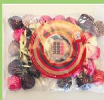
Bombons Deli&Co 100g 95 pontos