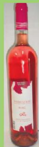
Vinho Verde Rosé Frutivinhos 0,75L 180 pontos