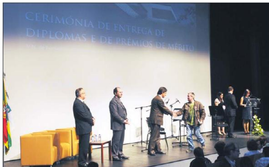
Cerimónia decorreu na Casa das Artes

município no ensino profissional, explicou que "os excelentes resultados alcançados pelo município se devem aos programas que implementamos na área da educação, mas deve-se principalmente à aposta na orientação vocacional". O vice-presidente sublinhou ainda que "a qualificação profissional dos recursos humanos são uma mais