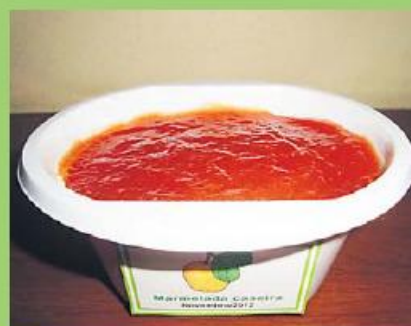
Marmelada 100g 150 pontos