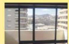
T3 usado -centro 60.000,00 €