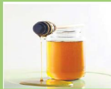
Mel Caseiro José Carneiro 500g 270 pontos