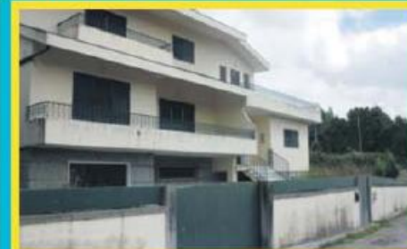
Morada em Vale S. Martinho ref: 1448

Morada Isolada T3 com localização muito privilegiada face ao Parque da Cidade e junto ao Nô da Variante Nascente (com acesso à A3/A7). Financiamento até 100% com spread de 1%! Preço: €137.000,00. Prestação: 379,04€/mês (prazo: 40 anos).