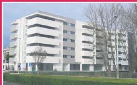
T4 de Luxo ref: 1439

Apartamento T2 com excelente terraço no centro de Famalicão, inserido em zona habitacional nobre. Equipado com estores elétricos, aquecimento central e vídeo porteiro. Cozinha mobilada e equipada. Aparcamento privado. Preço: €112.500,00.