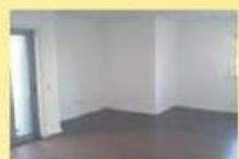
T2 c/ novo centro Só: 87.500,00 €