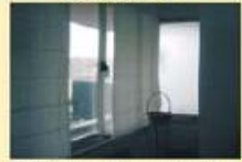
Escritorio 50 m2 Novo 30.000,00 €