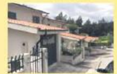
Moradia T3 - Loteamento 100.000,00 €