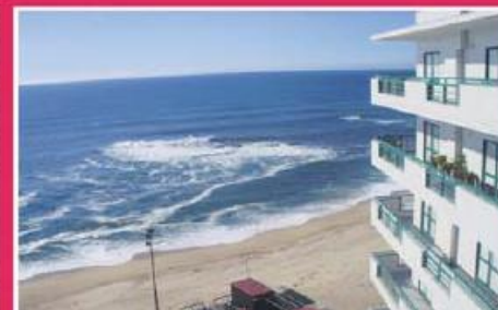
T3 na 1ª linha de mar! ref: 1446

Apartamento no centro de Famalicão, em excelente estado de conservação, com acabamentos de alta qualidade. Extensas vistas sobre a paisagem envolvente (Parque da Cidade). Garagem fechada para duas viaturas lado a lado. Consulte-nos!