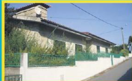
Morada em Antas ref: 1420

Morada de 3 frentes junto ao centro de Gondifelos, com excelentes áreas interiores e exteriores. Condições especiais de financiamento, com spread de 2%. Preço: €109.000,00. Prestação: 358,86€/mês (prazo: 40 anos).