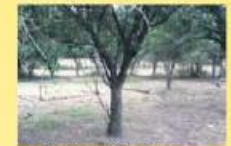
Bouça 20 hectares 400.000,00 €