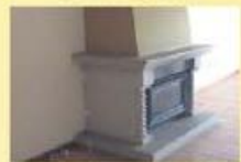
Moradia T3 Calendario Só: 100.000,00 €