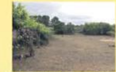
Quinta 30.000 m2 + Terreno 40.000 m2 600.000,00 €