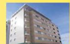
T2 Ed. Famicasa c/ Novo 97.500,00 €