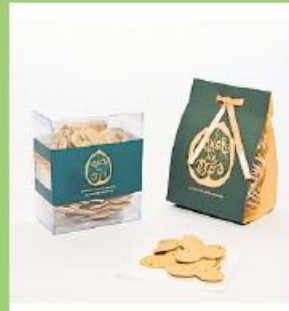
Biscoitos de Caju 150g 315 pontos