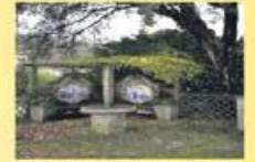
Propriedade de LUXO Sob consulta!!!