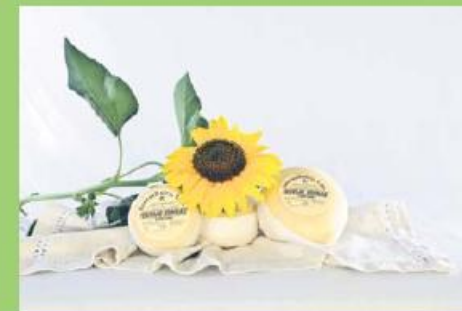
Queijo Senras 500g 450 pontos