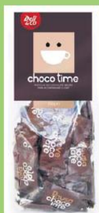
Pastilhas de chocolate 150g 195 pontos