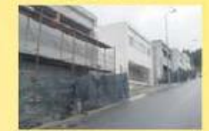
Moradia Canto p/ restauro 85.000,00 €