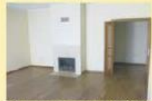
T3 junto ao centro NOVO 95.000,00 €