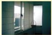
Escritorio 50 m2 Novo 45.000,00 €