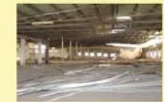
Armazem com 7.000 m2 Sob consulta!!!