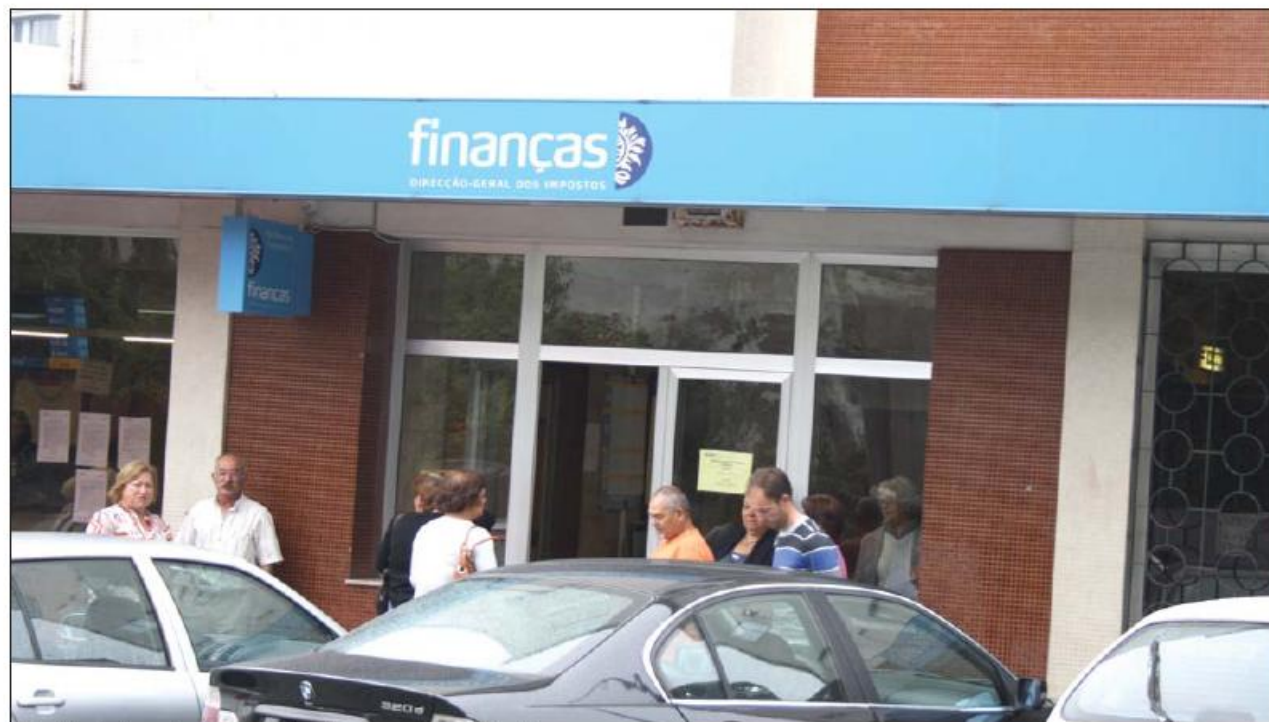
Cidadãos indignados com notificações que alegam indevidas

é um dos mais caricatos. A esposa, titular do registo de propriedade do veículo cujo imposto o fisco agora re-