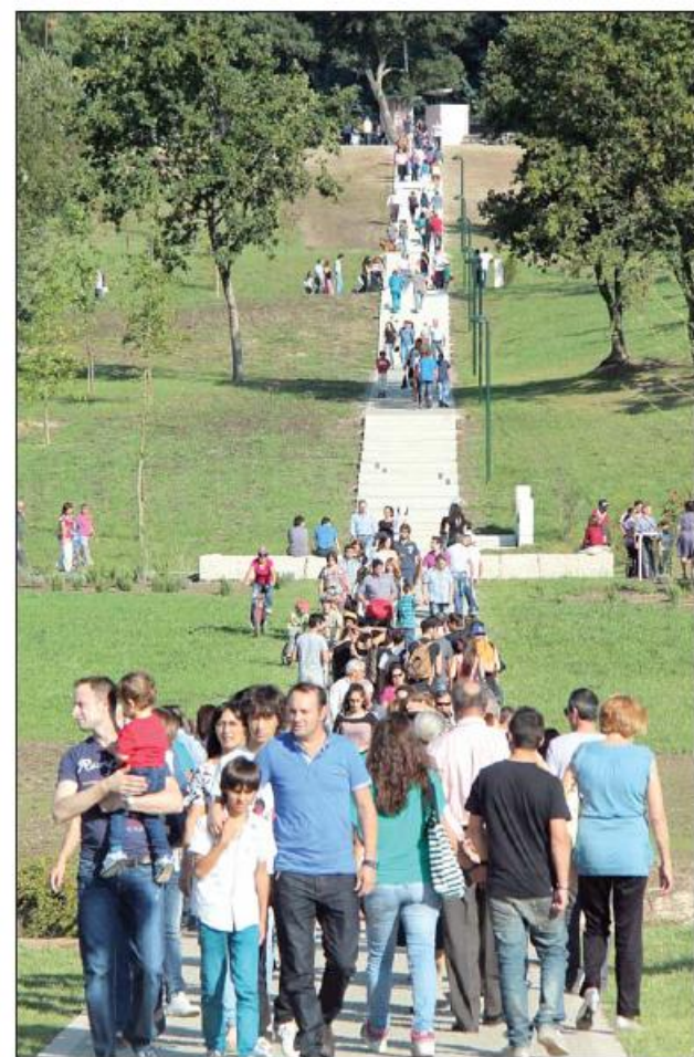
volvimento Regional. No total, contando com ações complementares, o valor ultrapassa os 18 milhões de euros.

As obras e ações realizadas no âmbito do programa de ação da "Parceria para a Regeneração Urbana do Parque da Devesa" foram cofinanciadas pelo ON.2, o Novo Norte, e QREN, através do Fundo Europeu de Desen-