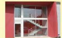
Armazem com 300 m2 145.000,00 €