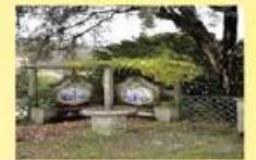
Propriedade de LUXO Sob consulta!!!

LOTEAMENTO DIVINE JA ABRIU... VILA NOVA FAMILICAO Rua de Serroes 9 LOTES DE 4 FRENTE