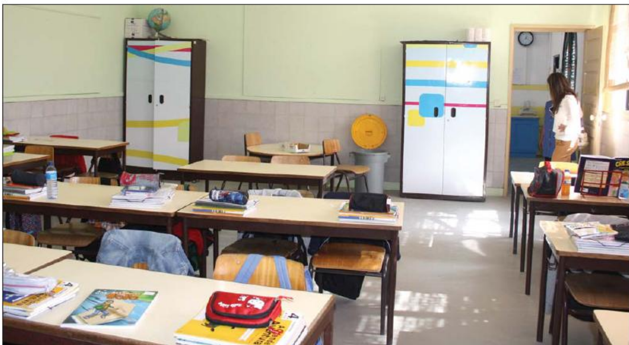
Salas de aula foram todas pintadas, os armários arranjados e o piso requalificado

A coordenadora adianta que as principais intervenções foram ao nível da comodidade, mas também da melhoria da estética interior da escola, onde permaneciam ainda cores carregadas e tristonhas. As obras passaram pelo fecho de algumas aberturas das paredes, efetuadas para fazer circular o ar numa altura em que aquecimento recorria a salamandras; pelo arranjo e embelezamento do soalho; reparação de portas e armários; e pela pintura de todas as salas de aulas, corredores e móveis. Nas casas de banho a Câmara assegurou as