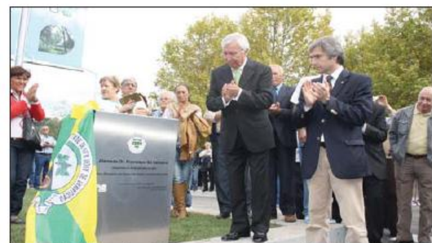
Alameda Dr. Francisco Sá Carneiro é acesso privilegiado à Devesa

ismo público mere-ce ser reconhecido e valorizado pela excelência”.