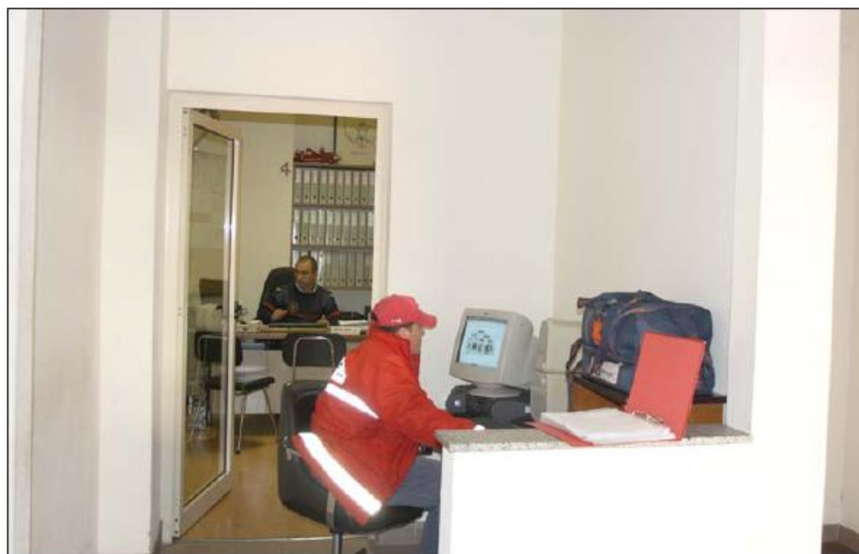
Intervenções dirigiram-se sobretudo à melhoria das condições operacionais

lhoria do piso e das condições gerais. Numa segunda fase a direção promoveu a reformulação da oficina onde se faz a manutenção das viaturas, foi criada uma sala de estar para os bombeiros, reformulados os gabinetes do comando e chefias, e o parque de viatura também sofreu pequenas intervenções no sentido de atenuar estragos decorrentes da passagem dos anos. No quadro dos me-