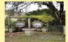
Propriedade de LUXO Sob consulta!!!