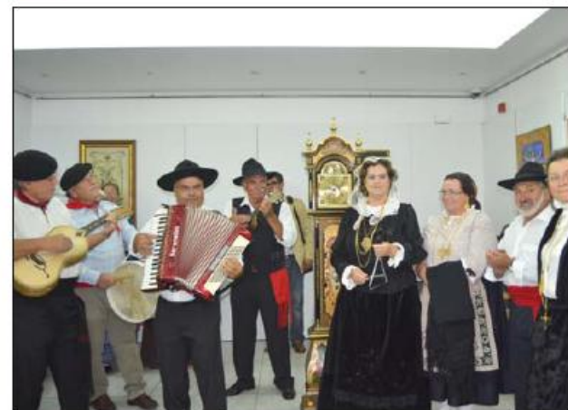
Danças e Cantares marcaram a inauguração da exposição

tada de terça a sexta-feira 14h00 às 17h30. das 10h00 às 13h00 e das A entrada é livre.