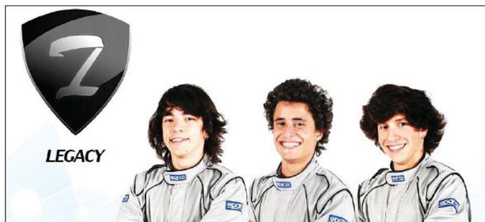
Os três famalicenses vão defender as cores de Portugal

Com a logística toda montada, a comitiva nacional já angariou a maior parte do dinheiro que lhe permitirá a deslocação ao Dubai, mas carece ainda de alguns recursos. O apoio de várias empresas, nomeadamente da