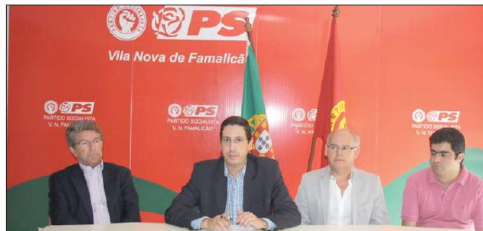
Socialistas usam palavras duras para desafiar Nuno Melo e Paulo Cunha