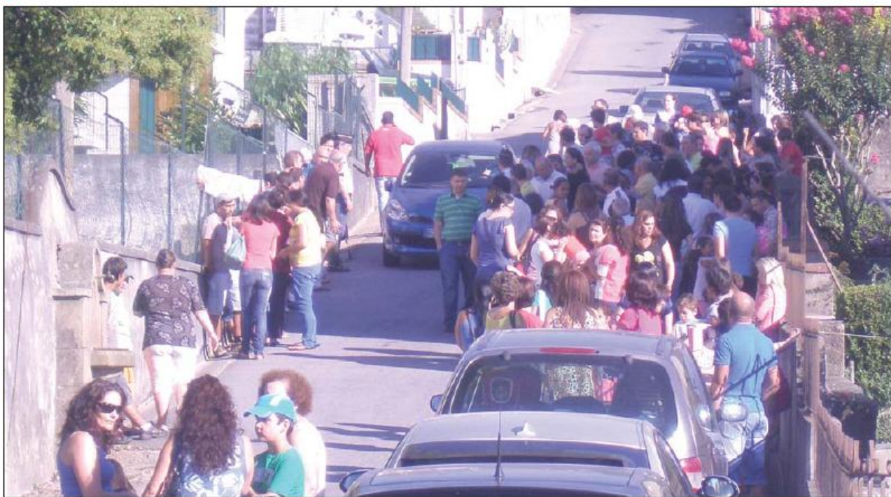
Pais juntaram-se à porta da escola, protestando contra corte de um docente