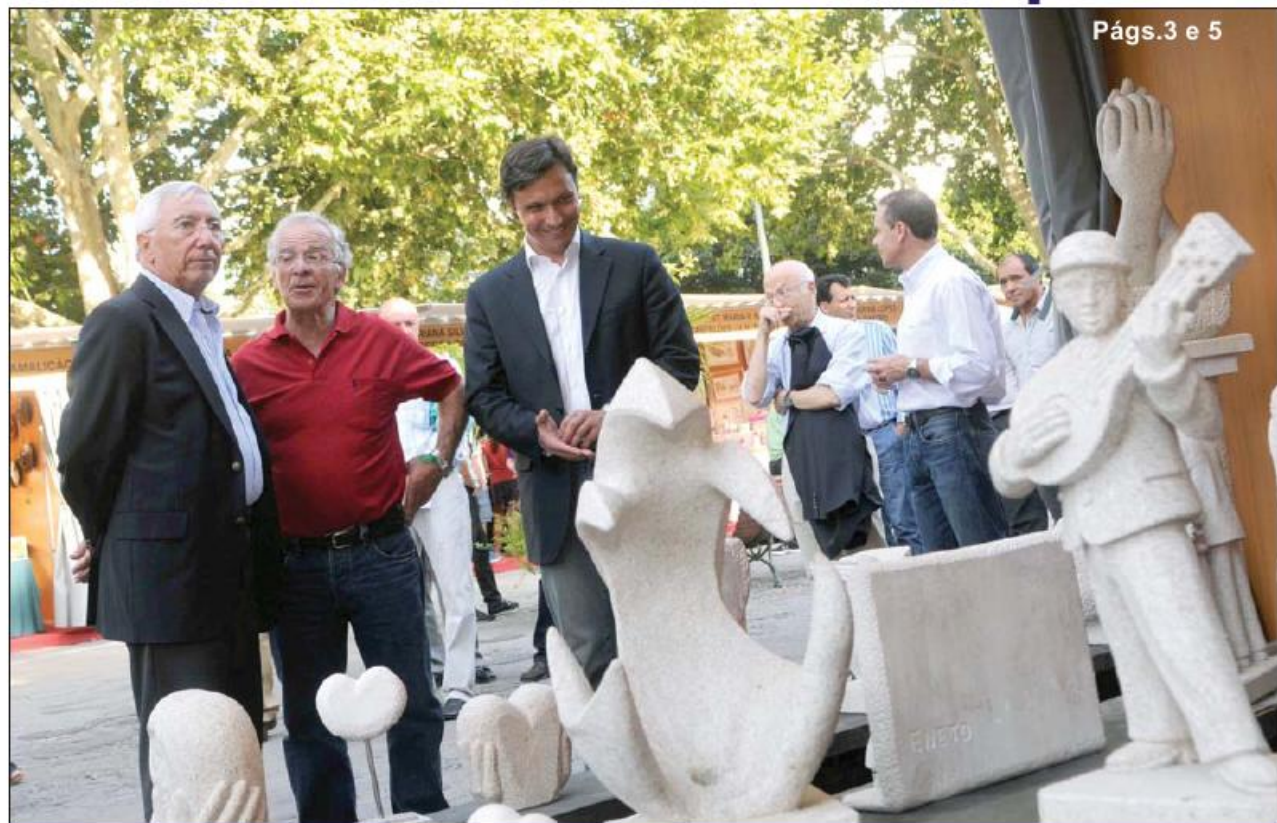
Págs.3 e 5