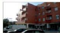
Louro T2 - T3, junto à EN - AMOB divisões muito amplas.