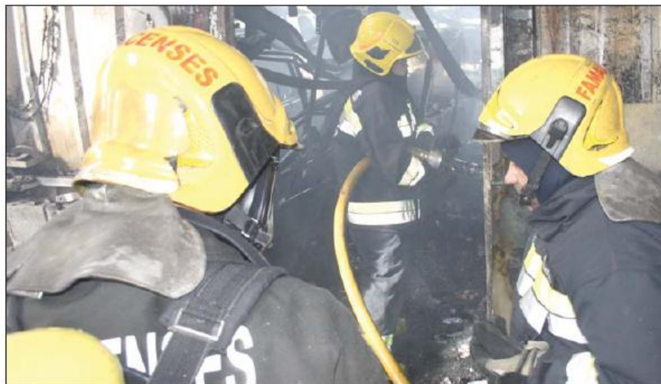
Quando os bombeiros chegaram ao local já não era possível salvar o recheio da serralharia

O responsável das operações adianta que o fogo foi rapidamente extinto, mas que infelizmente não foi possível salvar nada do interior da serralharia, onde existiam várias máquinas e outro material