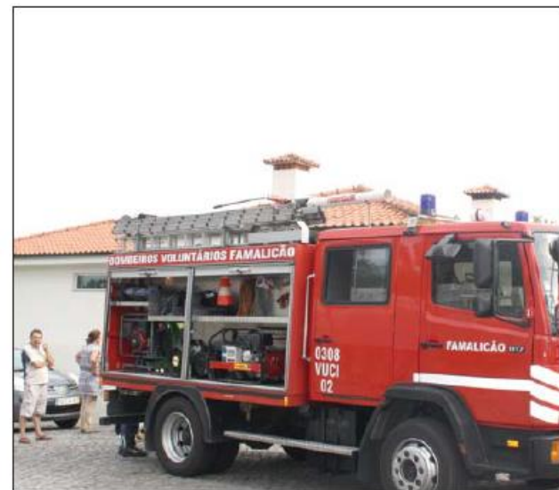
Fogo em residência terá começado com panela a fogueira

A cozinha de uma habitação ficou totalmente danificada na sequência de um pequeno incêndio que terá sido desencadeado por uma