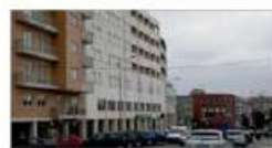
VN Famalicão T3 Cidade, Junto Leclerc. Garagem e arrumos; T3 Novo a Preço T2!!!