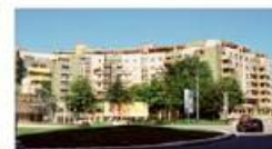
Antas - Rotunda Paz T2 C/ Aparcamento Excelente Área Cozinha Semi-Equipada