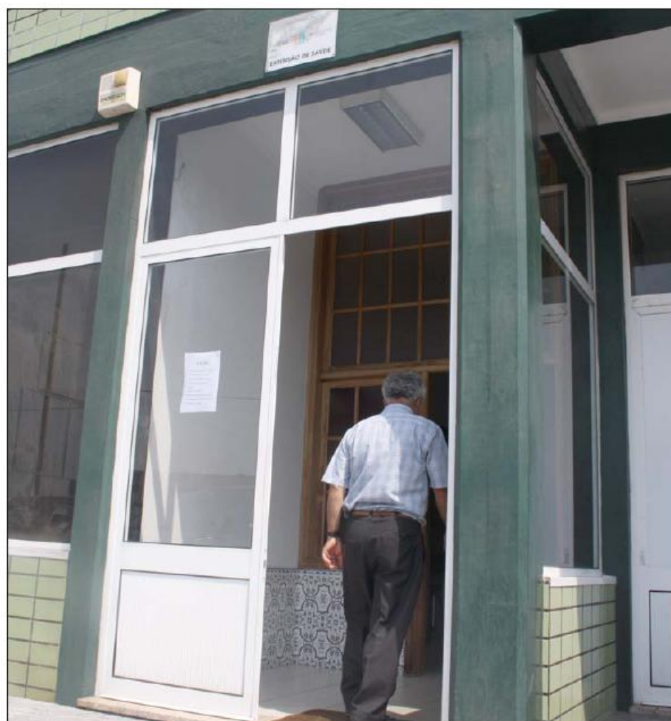
Comissão de Utentes volta a carga com novas queixas de ineficácia dos serviços

Ao que apurámos, entretanto, a falta da enfermeira terá surpreendido a própria médica destacada para a Ex-