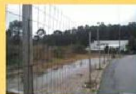
Terreno p/ Industria 65.000,00 €