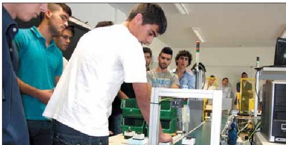
Alunos demonstraram domínio de várias tecnologias na construção desta linha de produção