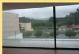
Moradia Nova Antas 185.000,00 €