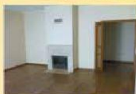
T3 - 95.000,00 € Novo

Loteamento DIVINE - lotes junto a cidade num lugar fantastico, sossegado, perto de tudo... Lotes desde 520 m2 - 87.500,00 €, com todas as infra-estruturas realizadas... Venha conhecer!!!