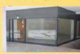
Loja - Area de 32,5 m2 31.000,00 €