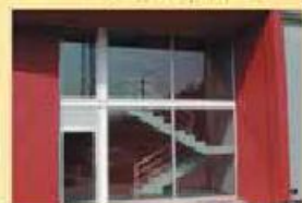
Armazem com 300 m2 155.000,00 €