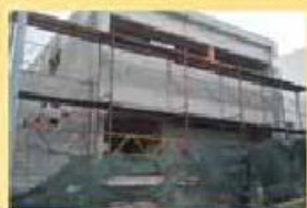
Moradia fase acabam. 90.000,00 €