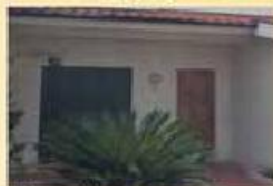
Moradia T3 Exelente 125.000,00 €