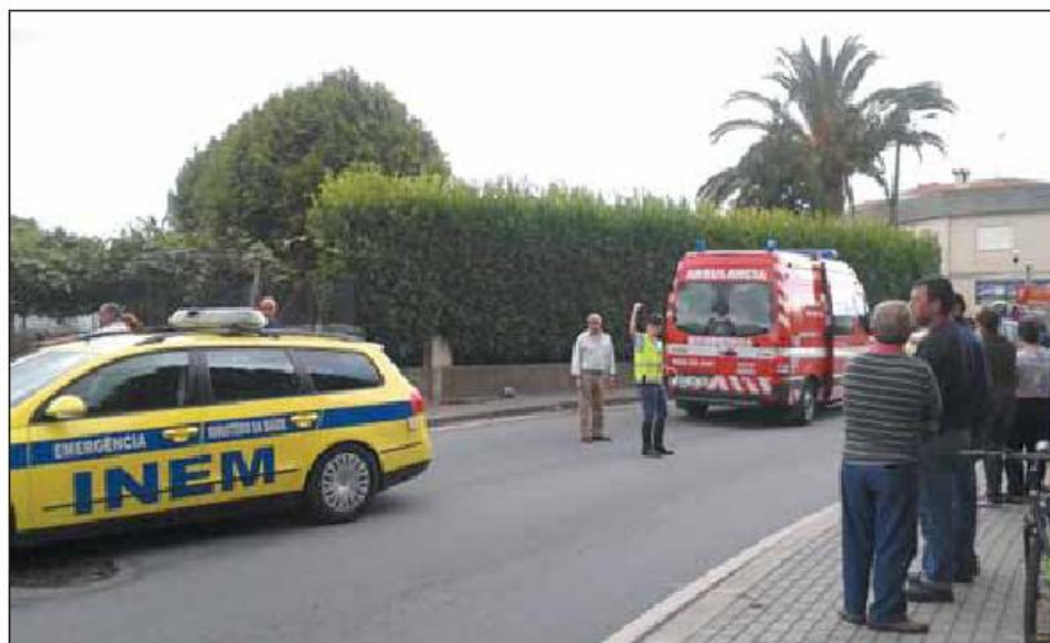
António Carvalho seguia no passeio quando foi atingido por uma porta de um camião

O homem de 63 anos caiu no passeio inanimado face à violência do embate da porta de ferro. O condutor do camião só se terá apercebido do sucedido cerca de cem