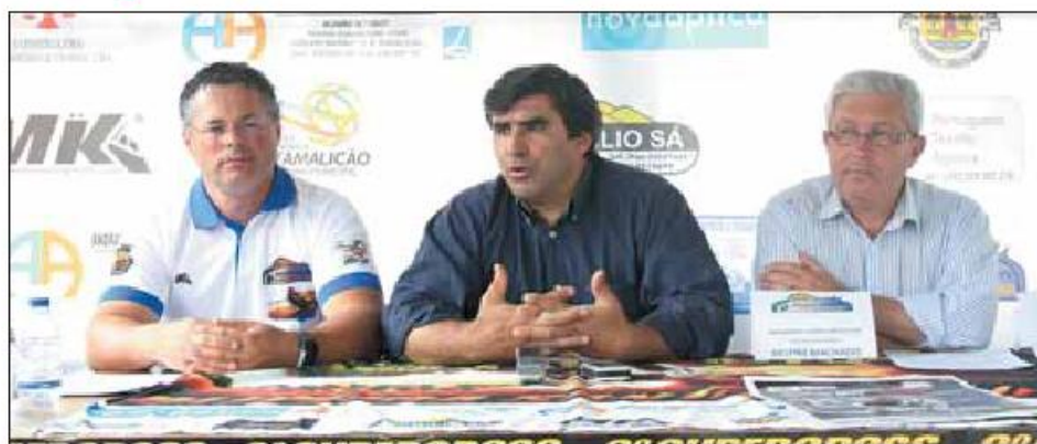
Prova é o arranque do Campeonato Nacional