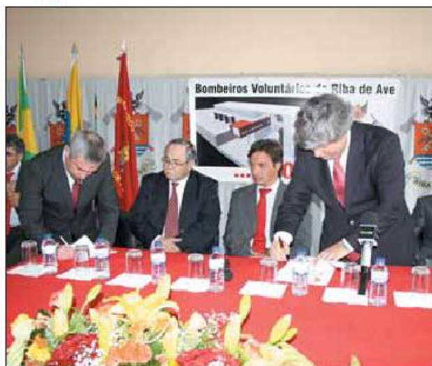
Adjudicação da obra decorreu em dia de aniversário da corporação

QREN (Quadro de Referência Estratégica Nacional) desde 2009, sofreu algumas vicissitudes que a foram catapultando para sucessivos adiamentos. Já no início deste ano, e depois de ter caído na "Operação de Limpeza" do QREN, para onde foram canalizadas as obras com uma execução inferior a dez por cento ou nula, como era o caso do quartel dos