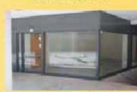
Loja - Area de 32,5 m2 31.000,00 €