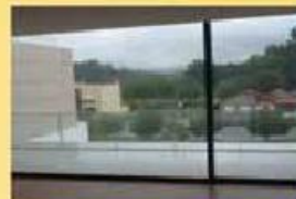
Moradia Nova Antas 185.000,00 €