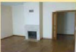
T3 - 95.000,00 € Novo

Loteamento DIVINE - lotes junto a cidade num lugar fantástico, sossegado, perto de tudo... Lotes desde 520 m2 - 87.500,00 €, com todas as infra-estruturas realizadas... Venha conhecer!!!