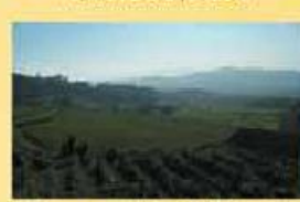
Terreno 20.000 m2 70.000,00 €