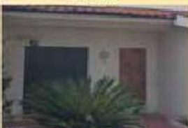
Moradia T3 Exelente 125.000,00 €