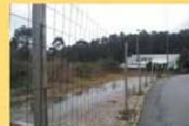
Terreno p/ Industria 65.000,00 €