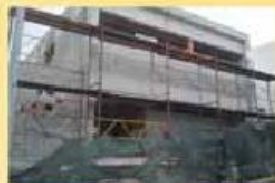
Moradia fase acabam. 90.000,00 €