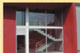
Armazem com 300 m2 155.000,00 €