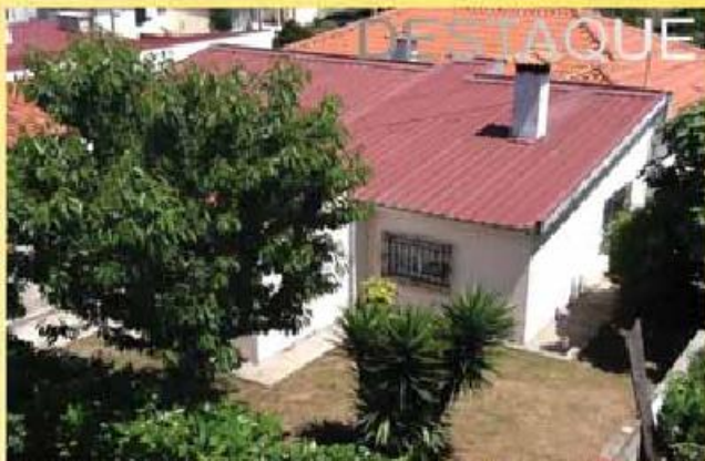
Vivenda, junto a cidade com 1000 m2 de terreno... 165.000,00 €

Rua Ernesto Carvalho, Ed. Nápoles - Loja 1 | Vila Nova de Famalicão 252 318 300 - 916 143 360 | comercial@imobolsa.com | www.imobolsa.com