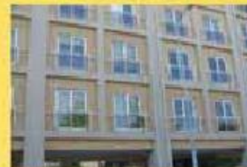
T3 Ed. Milénio Novo 165.000,00 €