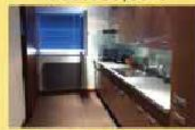
T2 - Talvai C/ novo 135.000,00 €