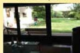
Vivenda T4 - Gaviao 215.000,00 €