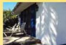
Quinta 8.000 m2 Fantástica c/ piscina