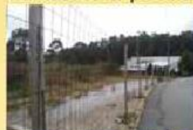
Terreno Industrial 65.000,00 €