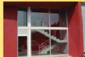
Armazem com 300 m2 155.000,00 €