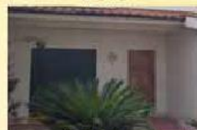
Moradia T3 Exelente 125.000,00 €