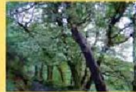
Bouça 33 hectares 750.000,00 €