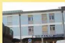
Predio - 3 apart. 1 loja 350.000,00 €