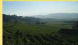
Terreno 20.000 m2 120.000,00 €