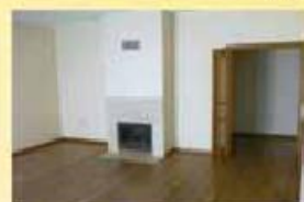
T3 - 95.000,00 € Novo