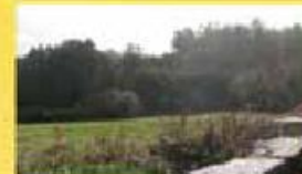
Terreno c casa 25.700 m2 210.000,00 €