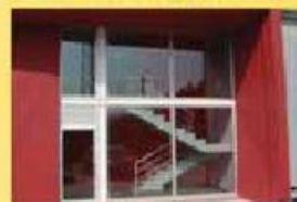
Armazem com 300 m2 155.000,00 €