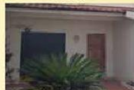
Moradia T3 Exelente 125.000,00 €