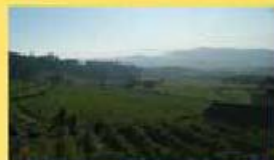
Terreno 20.000 m2 120.000,00 €