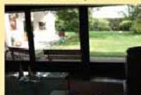
Vivenda T4 - Gaviao 215.000,00 €