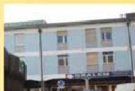
Predio - 3 apart. 1 loja 350.000,00 €