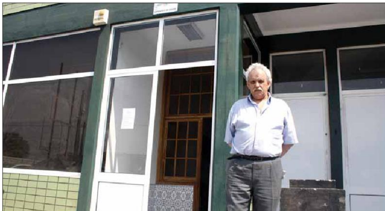
Utentes adiam receitas e consultas por causa na não substituição da médica