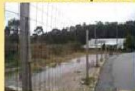
Terreno Industrial 65.000,00 €