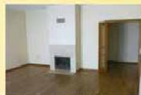
T3 - 95.000,00 € Novo