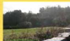
Terreno c casa 25.700 m2 210.000,00 €