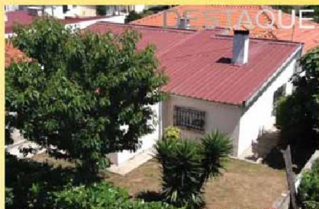
Vivenda, junto a cidade com 1000 m2 de terreno... 165.000,00 €

Rua Ernesto Carvalho, Ed. Nápoles - Loja 1 | Vila Nova de Famalicão 252 318 300 - 916 143 360 | comercial@imobolsa.com | www.imobolsa.com