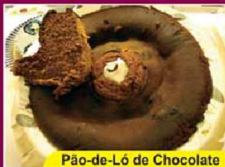
Pão-de-Ló de Chocolate