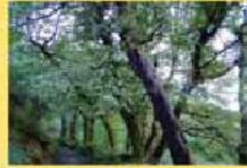
Bouça 33 hectares 750.000,00 €