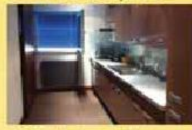
T2 - Talvai C/ novo 135.000,00 €