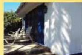
Quinta 8.000 m2 Fantastica c/ piscina