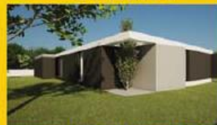
Vivenda T3+1 Centro C/4 frentes piscina... 245.000,00 €