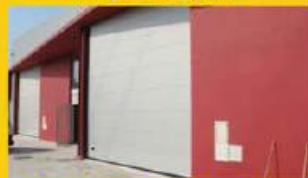
Pavilhão- Centro Cidade 160.000,00 €