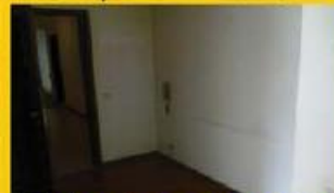
T1 Calendario - 35.000,00 €