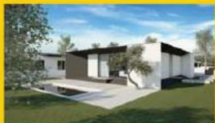
Moradia nova!!! Desde: 175.000,00 €

Rua Ernesto Carvalho, Ed. Nápoles - Loja 1 | Vila Nova de Famalicão 252 318 300 - 916 143 360 | comercial@imobolsa.com | www.imobolsa.com