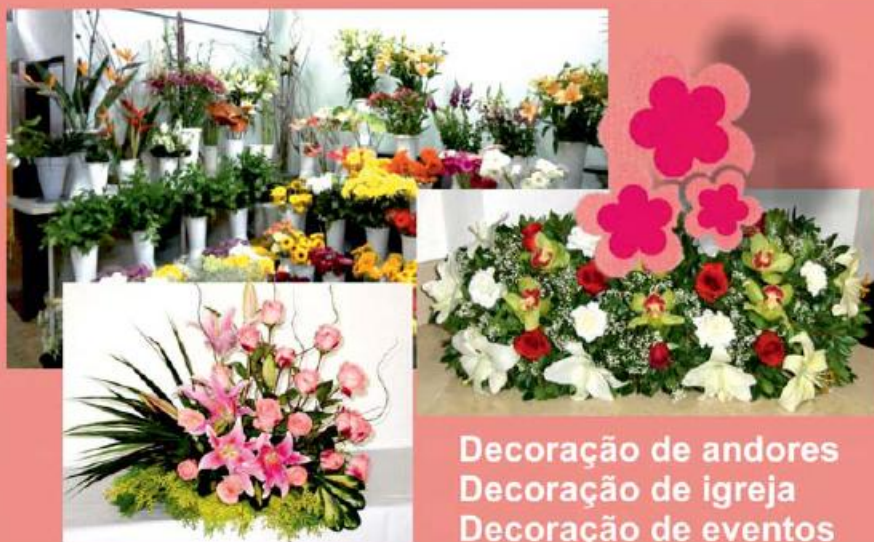
Decoração de andores Decoração de igreja Decoração de eventos

(Em frente ao Cemitério) Oliveira St. a Maria Terça-feira a sábado das 9h às 19h Domingo das 9h às 12h Tlm.: 933 968 099 E-mail: veraseara@hotmail.com