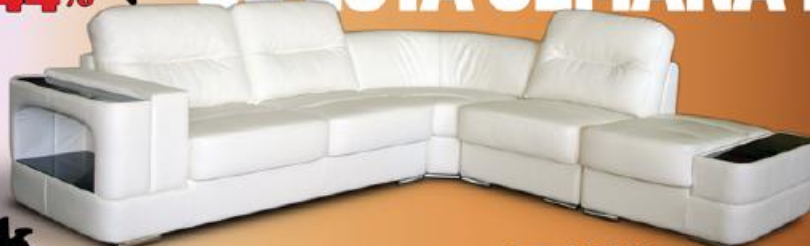
Sofá de canto Modelo Astral, disponível em várias cores.

APROVEITE AS ÚLTIMAS UNIDADES! SÓ ESTA SEMANA!