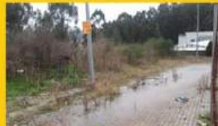
Terreno Industrial 1450m2