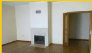
T3 Novo - 95.000,00 €