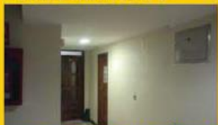
Escritorio c/ 45 m2 37.500,00 €