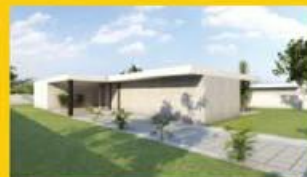
Vivenda Loteamento Nova 215.000,00 €