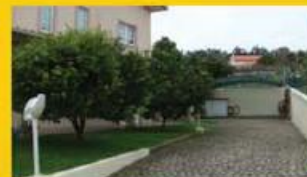
Moradia Santiago da Cruz 185.000,00 €