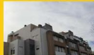
T3 Andar - 72.500,00 €