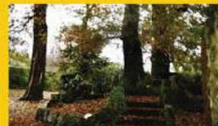
Quinta c/ 16.800 m2 centro Fantastico... Sob consulta!