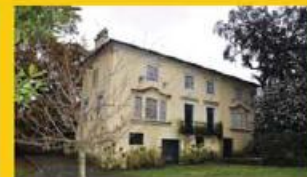
Propriedade centro cidade Informações sob consulta!!!