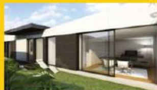
Vivenda Nova 4 frentes 210.000,00 €