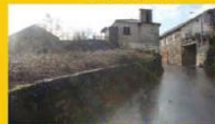
Quinta Viatodos 25.700 m2 215.000,00 €