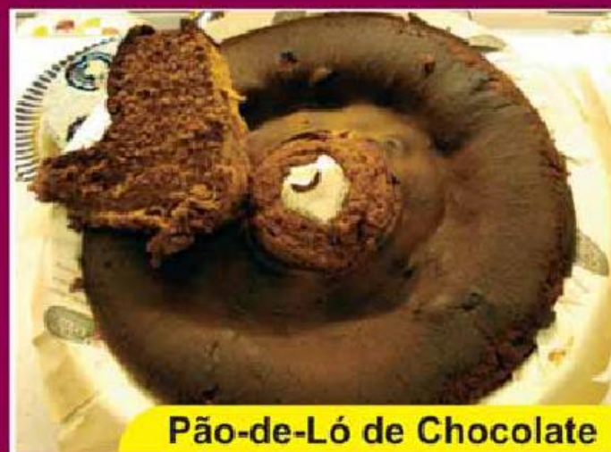
Pão-de-Ló de Chocolate