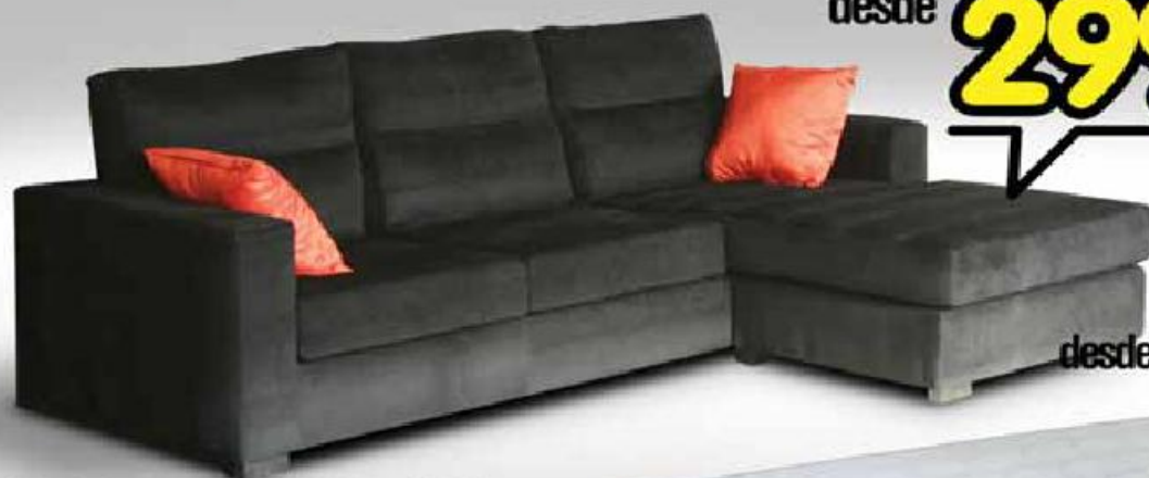
Sofá de 3 lugares com Chaiselongue Modelo Nano, almofadas decorativas não incluídas. Disponível em preto.