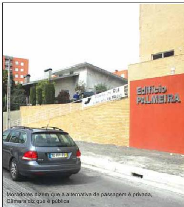
Moradores dizem que a alternativa de passagem é privada, Câmara diz que é pública