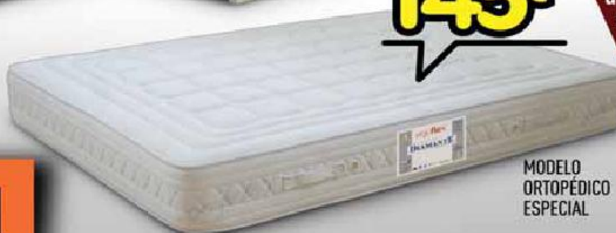
MODELO ORTOPÉDICO ESPECIAL