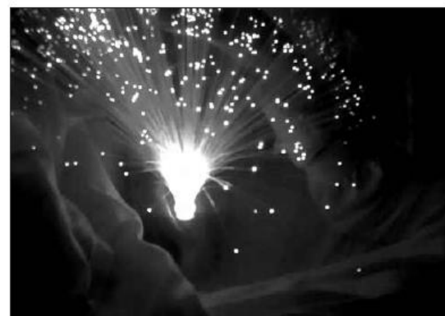
trabalho desenvolvido em cada um dos Lares.

– Estimulação Sensorial”, consiste em sessões semanais, realizadas em dois contextos diferentes. Na Sala de Fisioterapia, adaptada de modo a proporcionar um ambiente isolado de atracções exteriores; e em quartos de duas e, ou quatro camas, quando o trabalho é realizado com acamados. As sessões são realizadas no Lar São João de Deus e no Lar Jorge Reis, e são orientadas e realizadas de modo diferente atendendo à unicidade das duas populações. Estas especificidades serão apresentadas nos artigos relativos ao