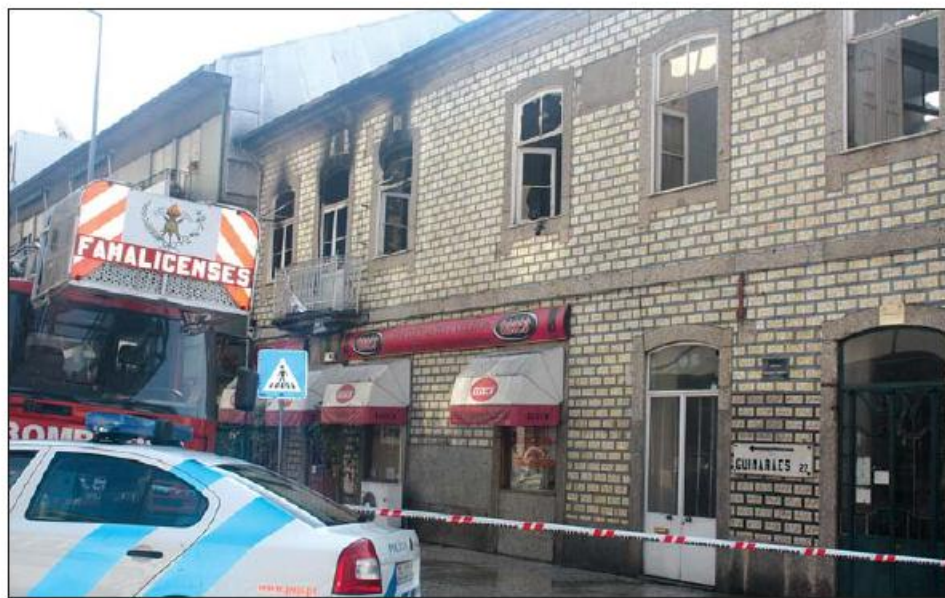
Vistoria desincentiva uso do edifício

O fogo terá começado num cabeleireiro, no piso superior do edifício, mas só terá sido detectado depois das três horas da manhã já