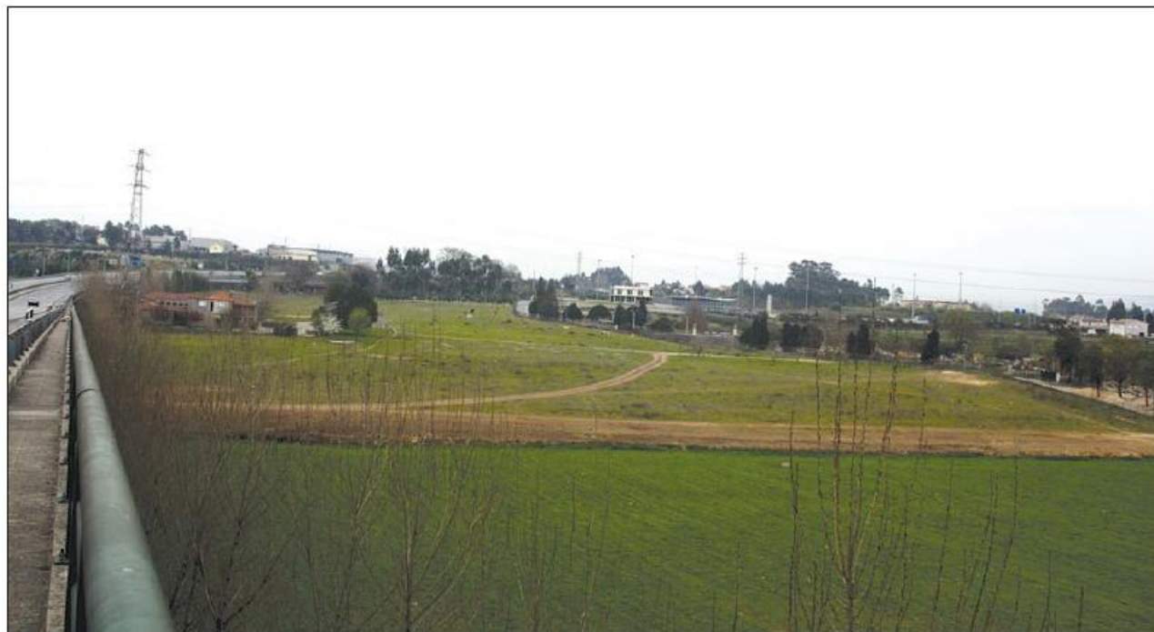
Terrenos da “Cidade Desportiva” têm localização privilegiada, junto à Variante e nó da A7