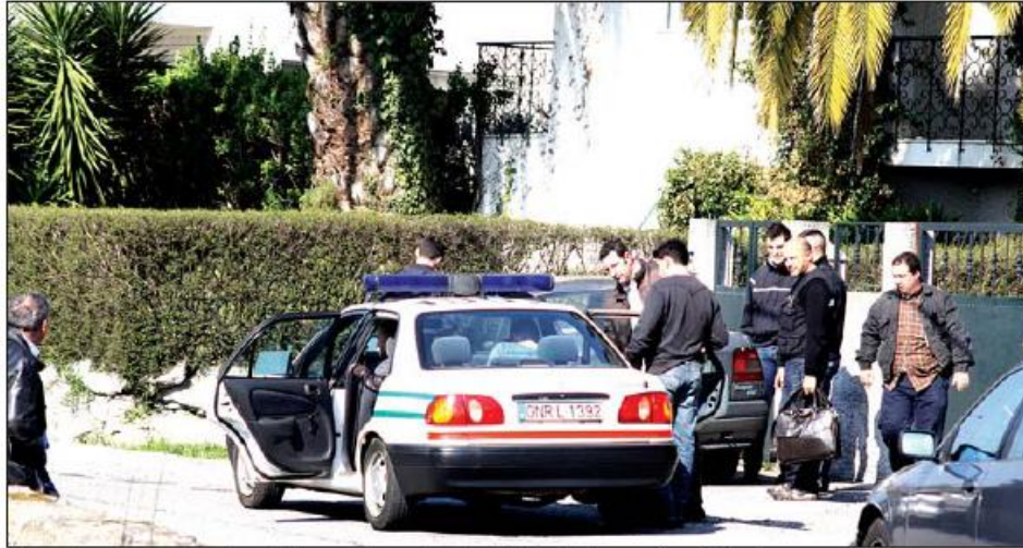
Momento em que um dos detidos era levado pela GNR após busca à residência

Relativamente aos detidos, o juiz de instrução decretou a medida de coação máxima, de prisão preventiva,