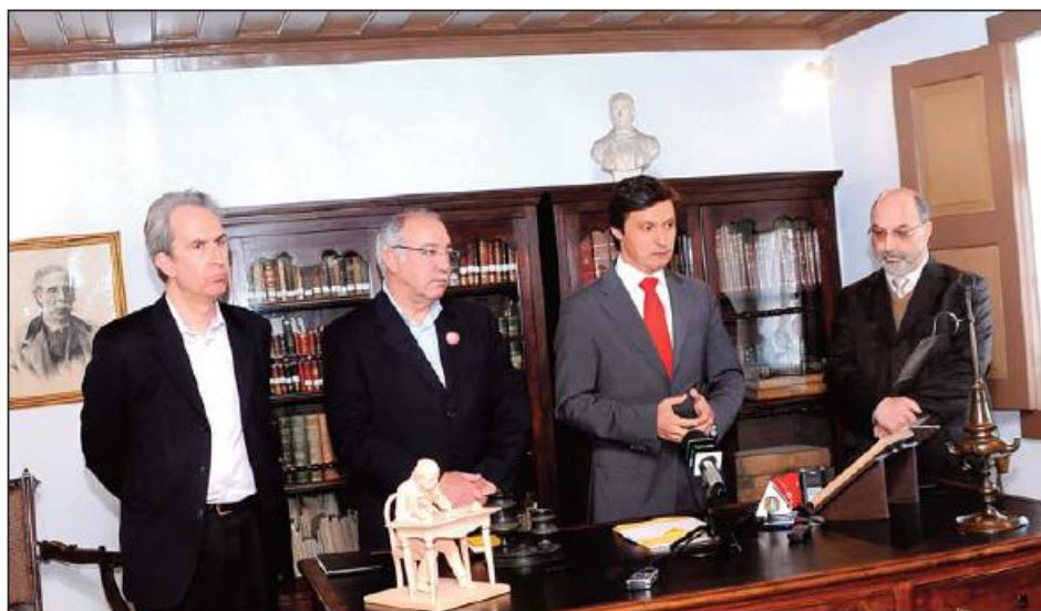
Apresentação da iniciativa decorreu na Casa-Museu de Camilo