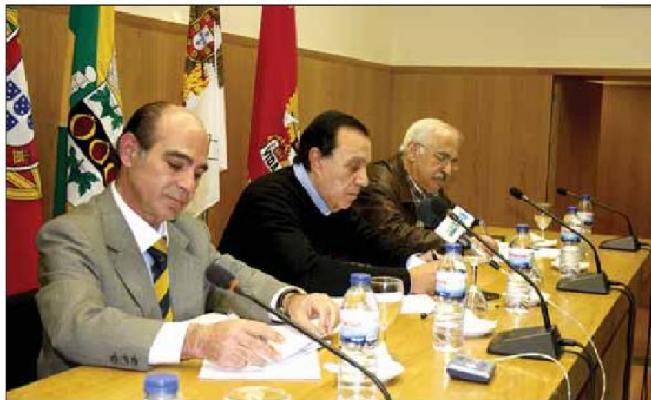
Os três presidentes da direção, subscreveram protocolo inicial