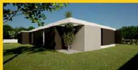
ican PARKING 1