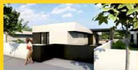
ican LIVING 1

Rua Ernesto Carvalho, Ed. Nápoles - Loja 1 | Vila Nova de Famalicão 252 318 300 - 916 143 360 | comercial@imobolsa.com | www.imobolsa.com