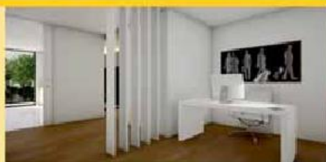
Vivenda nova de 4 frentes num lote de terreno de 550 m2 234.500,00 €