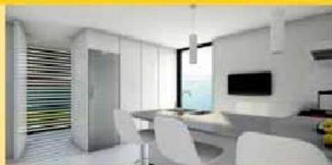
Vivenda nova de 4 frentes num lote de terreno de 510 m2 206.000,00 €