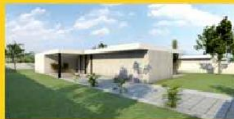
ican LIVING 2