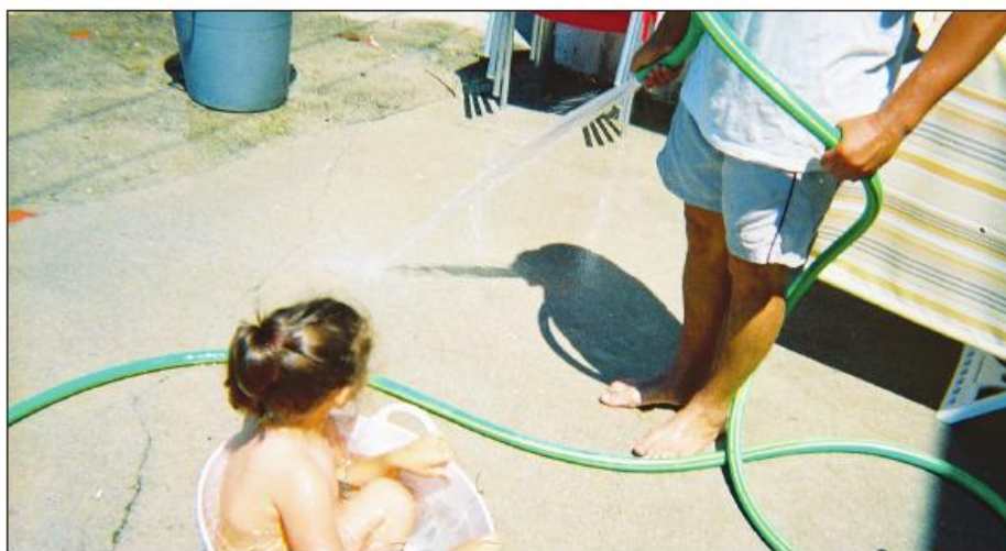
Carteiro famalicense contribuiu com esta fotografia para o livro com 200 retratos do Portugal de lés a lés

Cerca de seis mil carteiros acabaram respondendo positivamente ao desafio da empresa. Cada um recebeu uma máquina fotográfica, para que durante um mês retratassem o que quisessem. No final foram entregues 86 mil fotografias, das quais um júri, integrado por uma curadora, um fotógrafo e um elemento