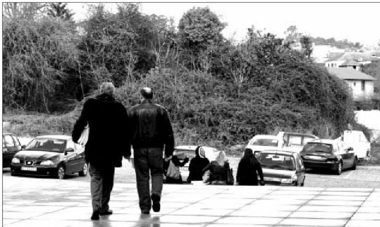
Arguido acompanhado do advogado à saída da audiência de alegações finais

Brochado Teixeira admite a condenação do seu cliente por um crime de detenção ilegal de armas, mas entende