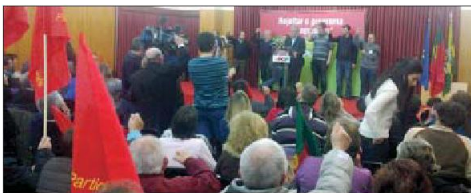
Cerca de 300 pessoas marcaram presença no comício realizado na Biblioteca Municipal

Nesta perspetiva, o líder dos comunistas aproveitou para salientar que o partido “saúda a CGTP-IN pela sua posição coerente e determinada na defesa dos direitos dos trabalhadores e dos interesses nacionais, contra o retrocesso social e civiliza-