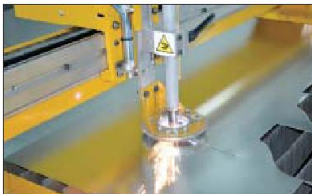
“Nhclima” foi a empresa do grupo que mais cresceu, passando de mera instaladora a fabricante de sistemas de ventilação e climatização

Quando a “Nhclima”, a história é bem diferente. A empresa começou por ser uma pequena empresa instaladora de climatização e ventilação, mas cedo percebi que faltava algo no mercado nacional a esse nível. Faltava uma empresa no setor da ventilação que dispusesse de stock permanente. Nesse sentido, inicialmente propusemos uma parceria a um fabricante de