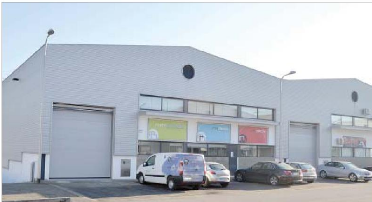
Crescimento do volume de negócio levou à mudança para novas e amplas instalações em Mouquim