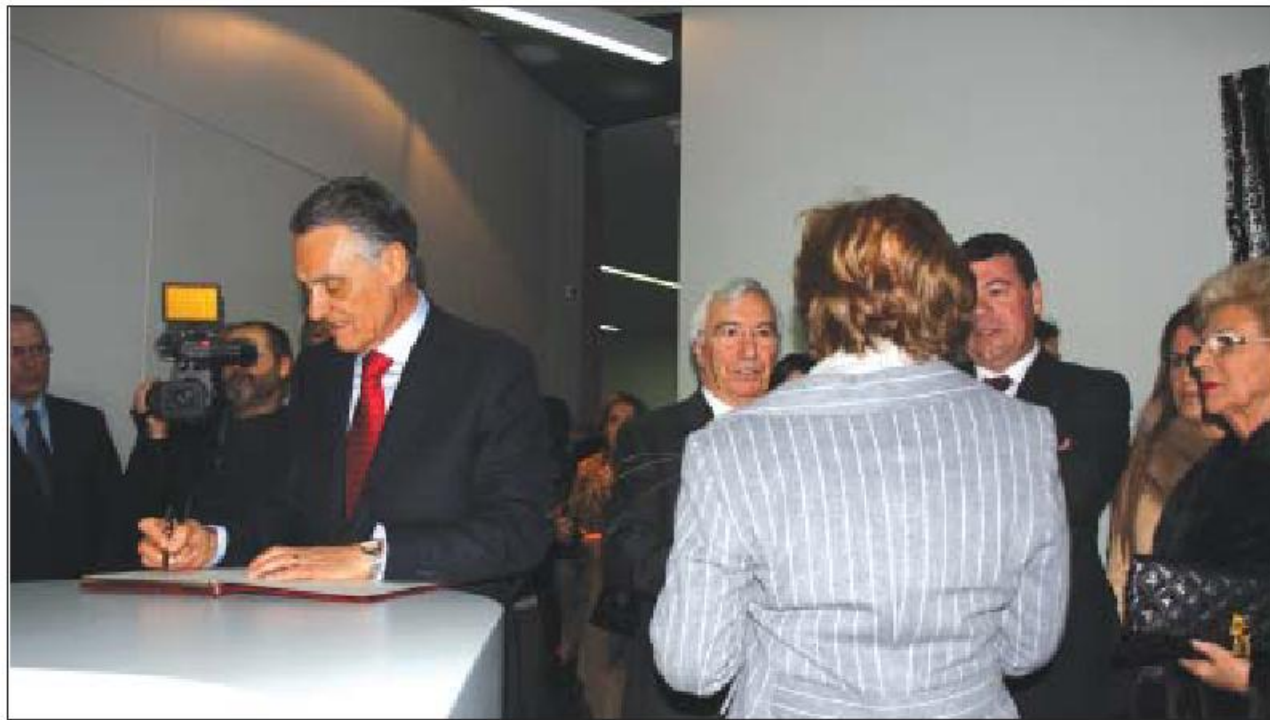
Presidente da República deixou dedicatória no Livro de Honra da Junta de Esmeriz

Consciente do dinamismo do concelho de Vila Nova de Famalicão, e do seu desempenho económico, Cavaco Silva frisou ainda que esta concretização é mais uma expressão desse empenhamento. Disse mesmo que Vila Nova de Famalicão se assume como “um concelho de oportunidades”, e que dá um contributo “muito significativo para que Portugal resolva alguns dos seus principais desequilíbrios”. Referiu-se em concreto à balança comercial concelhia, em que os índices de exportação são superiores aos de importação, uma rea-