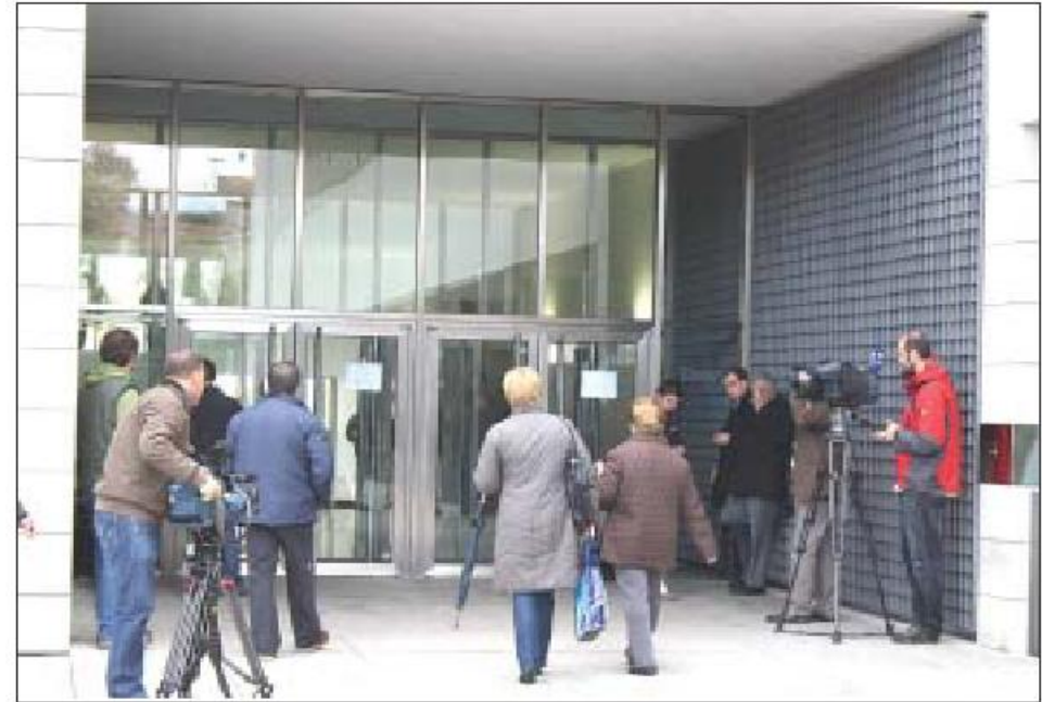
Primeira audiência captou a atenção de órgãos nacionais, mas a porta da sala de audiência manteve-se fechada