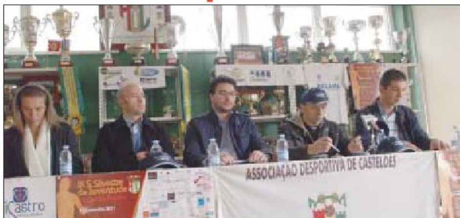
Prova foi apresentada na passada semana à imprensa

"Temos como limite de inscrições os 500 atletas e acreditamos que será possível alcançar essa fasquia, mas se tivermos 400 atletas a competir já será excelente",