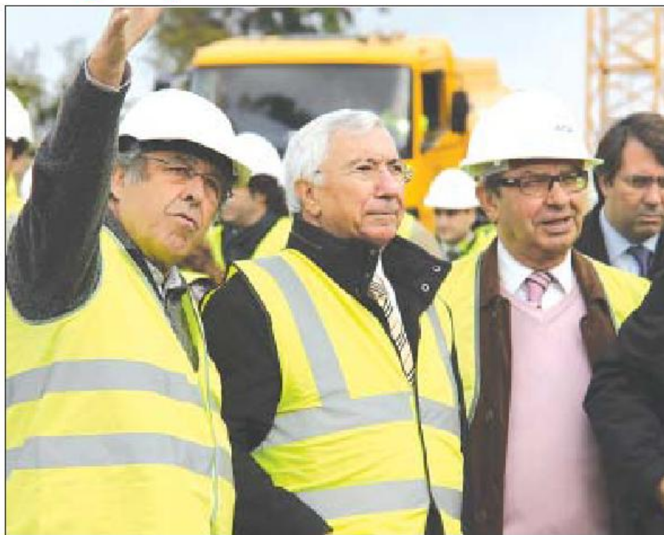
Comitiva visitou as obras do Parque da Cidade

O presidente da Câmara confessou-se muito satisfeito com o andamento da obra, e adiantou que "tudo quanto é construções também já se vê". Nesta perspectiva, o responsável autárquico entende "que lá para a Páscoa já será