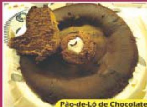
Pão-de-Ló de Chocolate