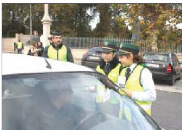
Crianças abordaram condutores e passaram a mensagem

A reacção dos condutores à iniciativa foi, segundo o tenente da GNR, "muito positiva" e de sensibilidade para as informações que lhe foram transmitidas. Notou ainda que os condutores acharam "particular interesse ao facto desta abordagem ser feita pelas crianças", reco-