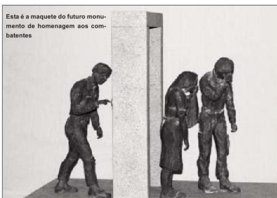
Esta é a maquete do futuro monumento de homenagem aos combatentes