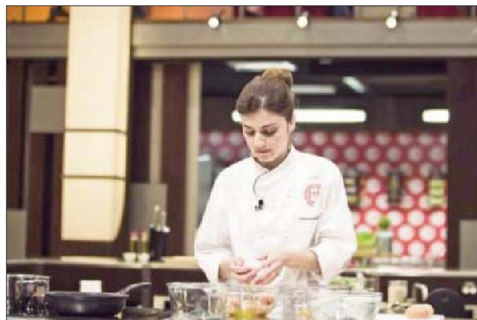
Tempero certo e instinto da famalicense, votou a seduzir o júri