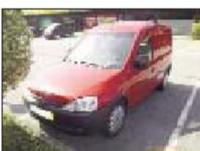
OPEL COMBO 1.3 CDTI 2005, 87.000 Kms, pneus novos. Tel. 937 183 300

VENDO OU ALUGO Vivenda T5, em Antas. 969 994 181