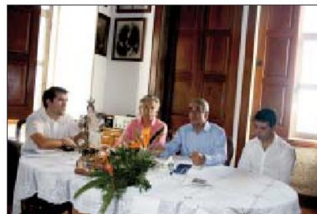
Museu deverá estar concluído no início de 2012

Por expor deverão ficar apenas as peças de maior valor, entre as quais artigos em ouro, prata ou bronze, dado que o edifício não compre-