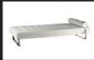
CHAISE LONG | BRANCA €475,00